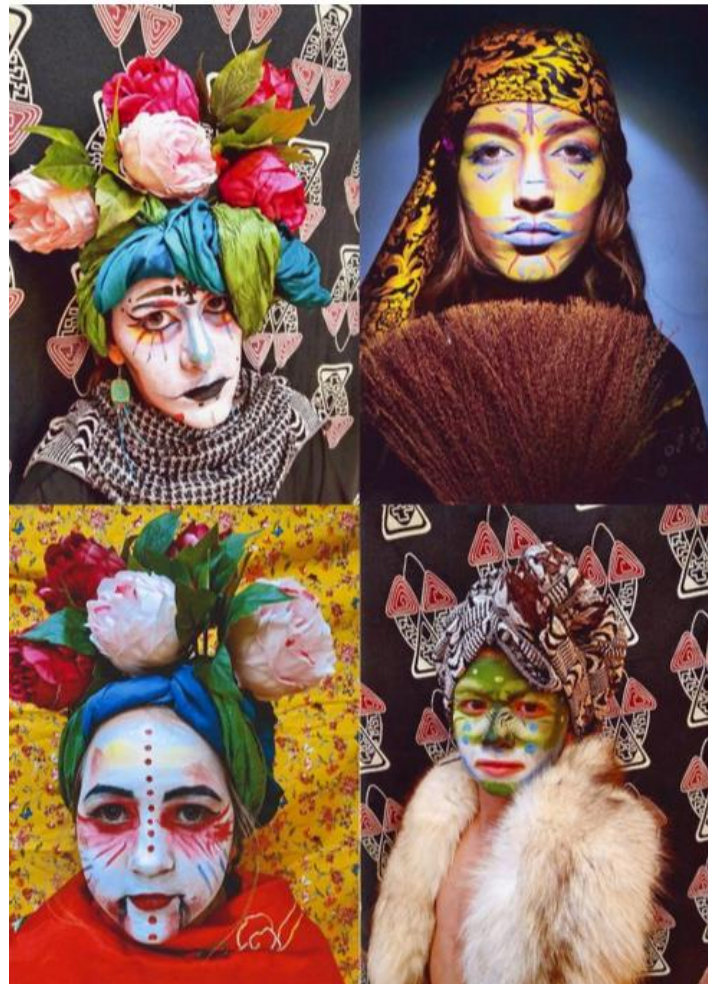
Malba, kresba: Kolektivní práce dětí „Karavana - Kočovník“, 265/7639-15 let, Krnov - ZUŠ Drahomíra Malovaného s.r.o., Dvořákův okruh 290/21, Česká republika